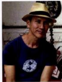
ศิลปิน นักร้อง ผู้นำแรงบันดาลใจ จากบทเพลงมา ผันเปลี่ยนเป็นโรงแรม หรูริมน้ำเจ้าพระยา ที่ชื่อ The Siam